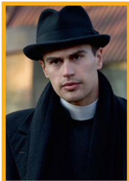
ТЕО ДЖЕЙМС /Theo James/ – отец Гаунт

Родилась 17 апреля 1985 года в Нью-Йорке. В 2015-м снялась в фильме «Кэрол», за роль в котором получила приз Каннского кинофестиваля, а также была номинирована на премии «Оскар», «Золотой глобус» и BAFTA. Кроме этого, снималась в фильмах: «Таннер Холл», «Социальная сеть», «Девушка с татуировкой дракона», «В бегах», «Побочный эффект», «Свалка», «Пэн: Путешествие в Нетландию», «Лев».