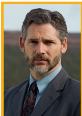
ЭРИК БАНА /Eric Bana/ – доктор Грин

Родился 23 января 1992 года в Лонгмонте, штат Колорадо, США. Снимался в фильмах: «Что сделал Ричард», «Холод», «Трансформеры: Эпоха истребления», «Гласленд», «Лондонские каникулы», «Макбет».