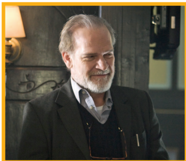
ЛУИС ОМАР /Lluís Homar/

Родился 16 июня 1978 года. Немецкий актер, уже много лет пребывающий в статусе европейской звезды. Этому поспособствовали его прекрасные роли в фильмах «Гудбай, Ленин», «К чему помыслы о любви?» (за обе – премия Европейской киноакадемии), «Сальвадор». В 2006-м снялся в составе большой интернациональной компании (Томас Кречманн, Евгений Миронов, Ингеборга Дапкунайте, Джон Малкович) в российско-английском фильме «По этапу», рассказывающем о Второй мировой войне. В 2009-м сыграл в «Бесславных ублюдках» Квентина Тарантино. Мать актера – испанка, и на своей родине (он родился в Барселоне) Брюль снялся не впервые.