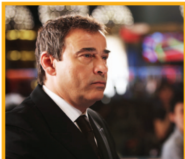
ЭДУАРД ФЕРНАНДЕС /Eduard Fernández/

Родился 20 апреля 1957 года в Барселоне. Лауреат Национальной испанской кинопремии Гоя («Ева») и многократный обладатель других кинонаград. Снимался в фильмах «Прозрение», «Разомкнутые объятия», «Западня Ферма», «Дурное воспитание».